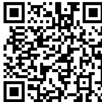
QR Code แบบฟอร์มการ