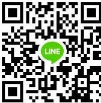
QR Code กลุ่ม